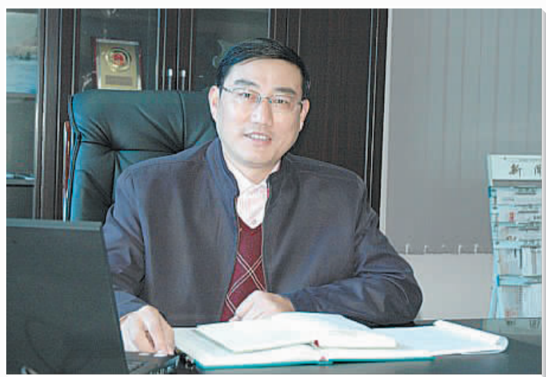
镇党委书记 吴佩坤