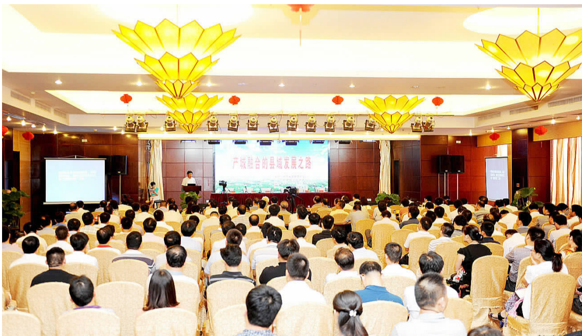
图为金湖发展论坛现场