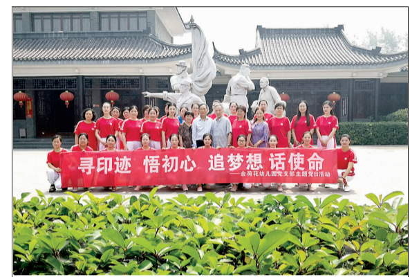
“寻印迹 悟初心 追梦想 话使命”。近日，金荷花幼儿园组织党团员、入党积极分子，走进中国人民抗日军政大学第八分校旧址，开展主题教育活动，引导大家把个人的思想实际与工作的实际紧密结合，更好地做好幼儿保教工作。孙达萍 摄