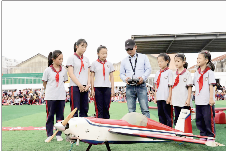
日前，县育才小学举办《科学大众》“快乐科学校园行”活动。活动通过机器人表演、航模飞行演示、课堂实验教学等与学生现场交流互动，让学生亲身体验和感受科学，在快乐中学习，从小爱科学、学科学、用科学，促进学校科技教育的进一步提升。