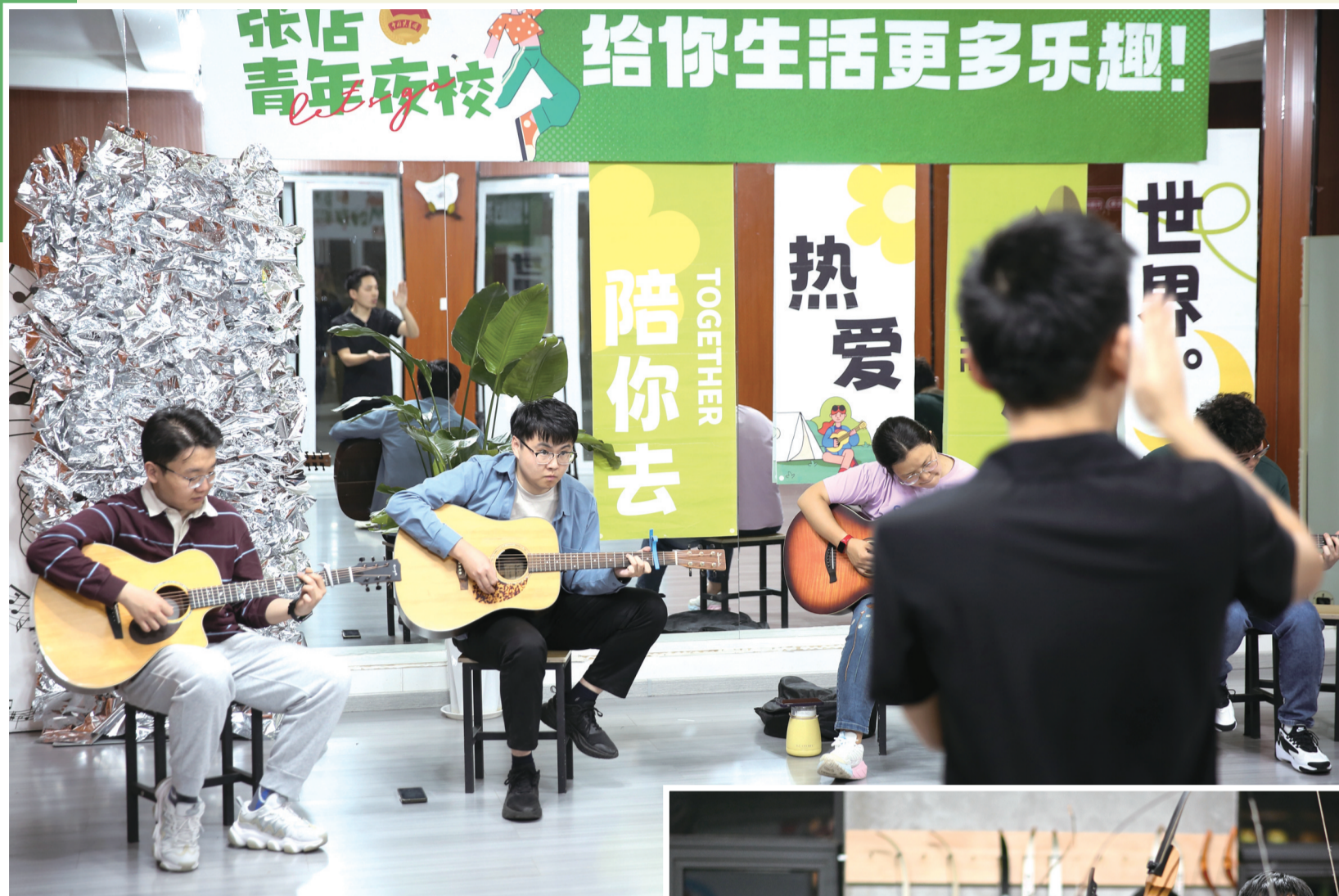
5月10日,在位于山东省淄博市张店区和平街道的青年夜校,学员在学习吉他。