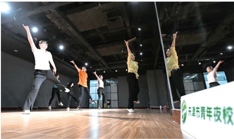
4月23日,在天津青年宫,学员在青年夜校练习有氧健身舞。