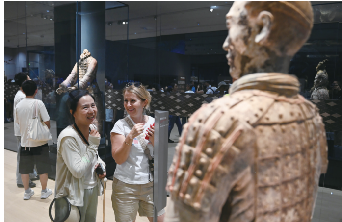
在秦始皇帝陵博物院,观众观看“千古一帝的地下王国——秦始皇陵考古发现展”上展出的兵马俑(2024年9月8日摄)。