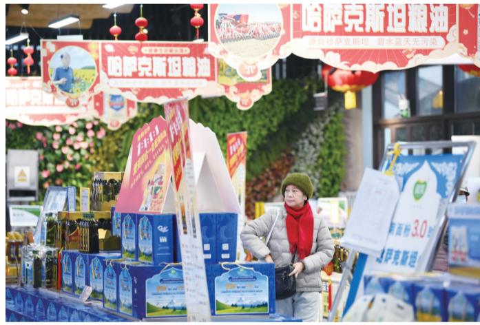
消费者在“中欧班列(西安)进口商品年货节”上挑选哈萨克斯坦粮油产品(2024年2月1日摄)。