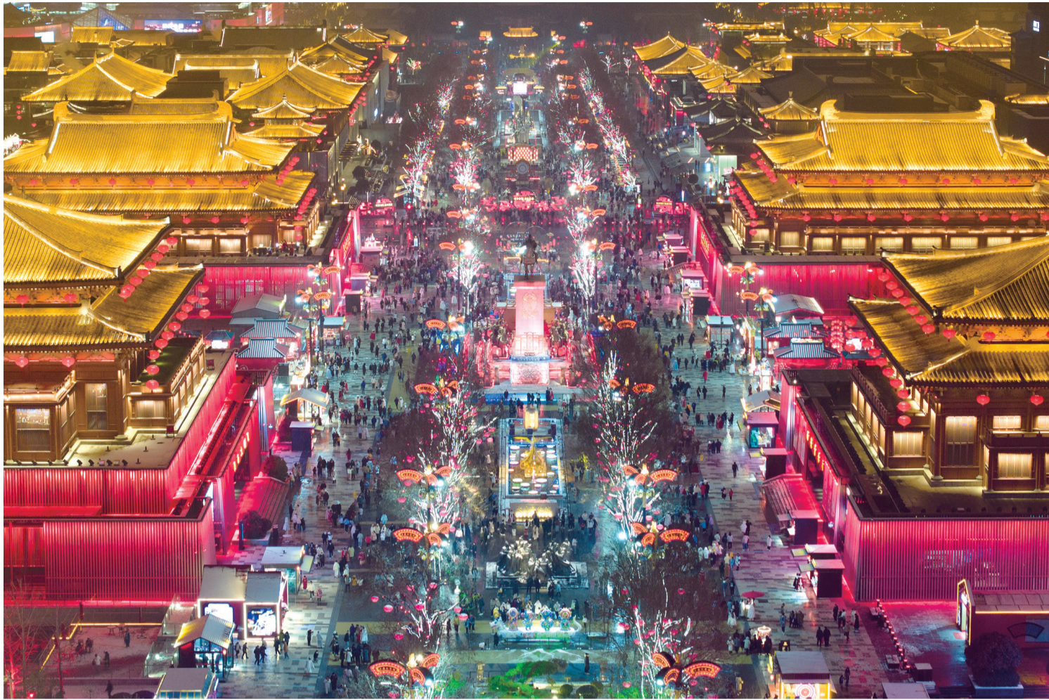
游客在西安大唐不夜城步行街游览(无人机照片,2024年2月2日摄)。

悠悠文脉,绵延千年;弦歌不辍,薪火相传。沿着总书记指引的方向,西安坚定文化自信、勇担新时代的文化使命。城墙脚下、大雁塔旁、曲江池畔,一幅走向文化繁荣的图景徐徐铺展,城市创新发展活力澎湃。