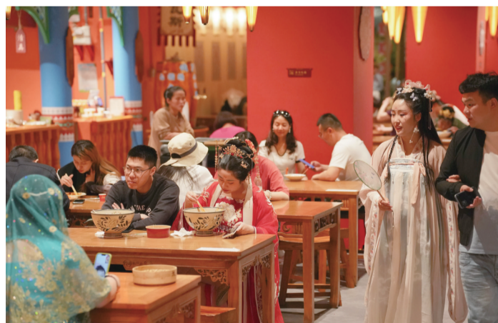
身着汉服的游客在西安“长安十二时辰”主题街区用餐(2024年5月11日摄)。