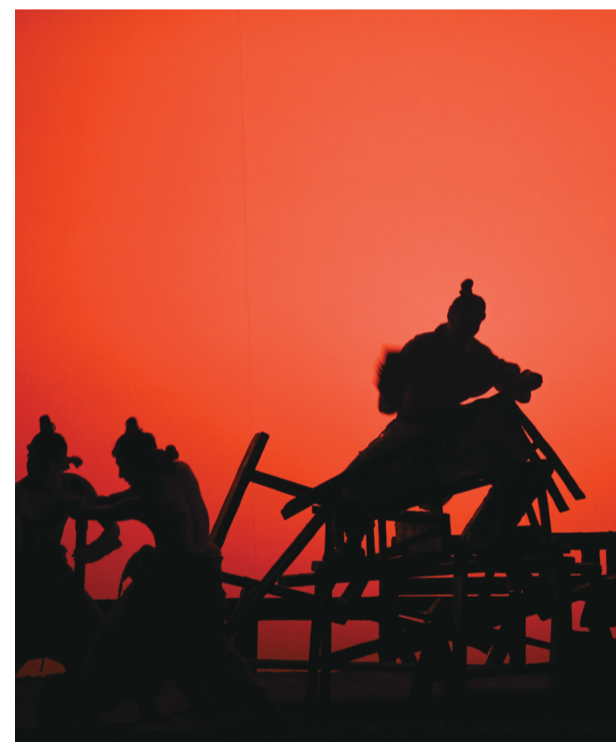
这是以“云梦睡虎地黑夫木牍”为灵感创排的大型历史舞台剧《赳赳大秦》演出现场(2024年9月25日摄)。