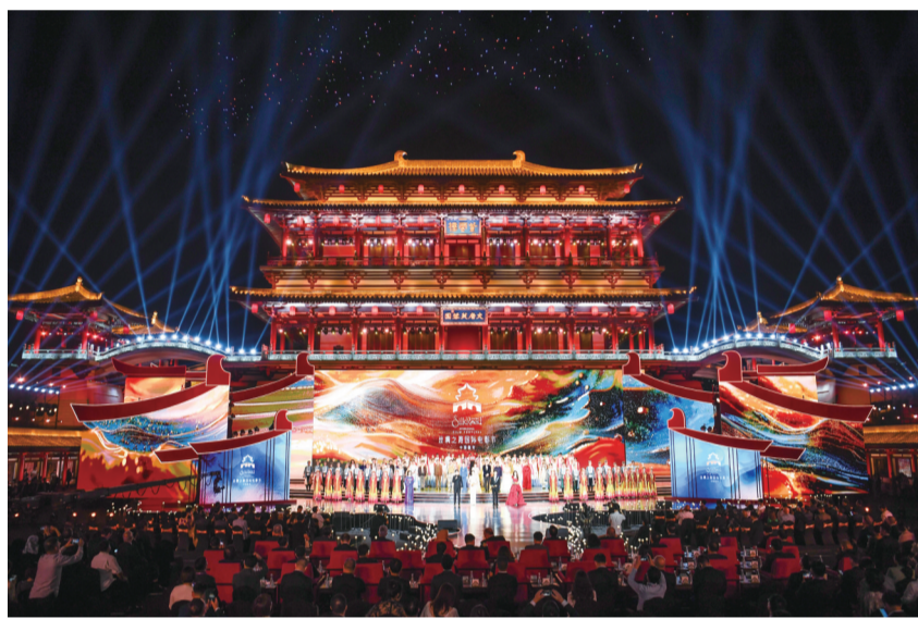
第十一届丝绸之路国际电影节开幕式在西安举行(2024年9月21日摄)。