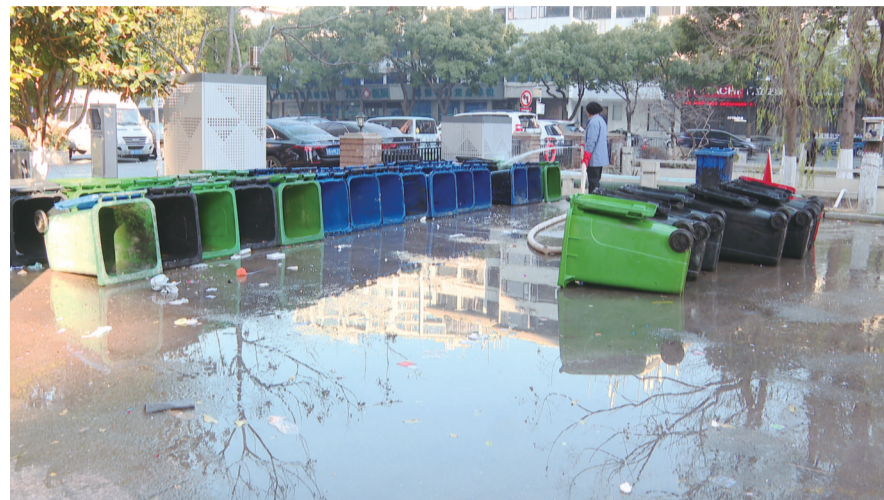
保洁人员正在清洗垃圾桶。

近日,有市民通过“澄心帮”平台的“大家拍”板块留言反映:阳光国际花园小区北门附近存在污水直排现象。工作人员冲洗垃圾桶产生的污水,未经处理便直接流入河道,不仅影响了周边居民的正常生活,更引发了百姓对河道生态环境的担忧。