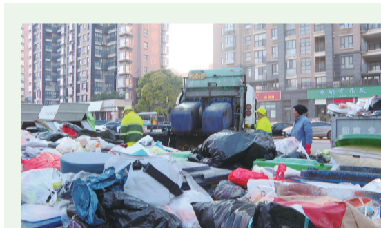
环卫车辆正在清运垃圾。