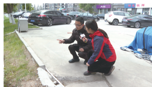
工作人员介绍现场情况。