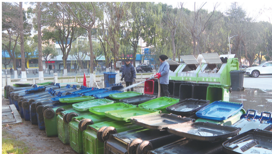
保洁人员正在冲洗桶内污渍。