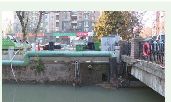
污水没有经过处理,直接流进河道。