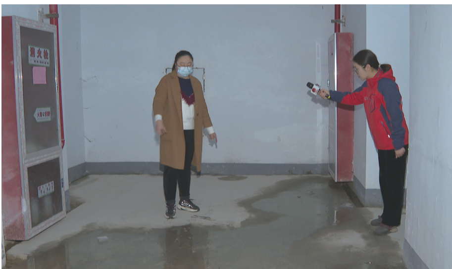
业主正在向记者介绍情况。