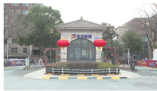
阳光国际花园小区北门。