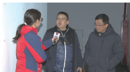
房产公司代表表示已经着手整改处理。