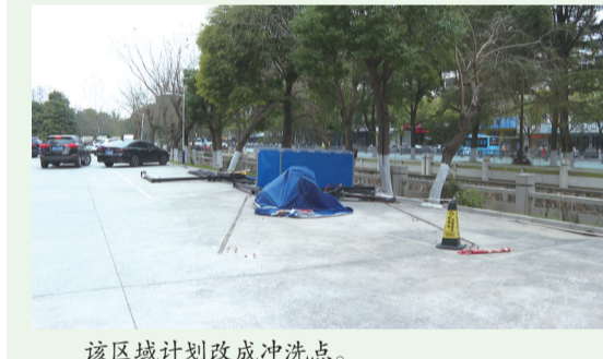
该区域计划改成冲洗点。