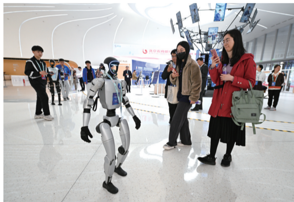
2025年3月26日,北京中关村国际创新中心的一款正在行走的宇树G1机器人吸引人们拍照留影。