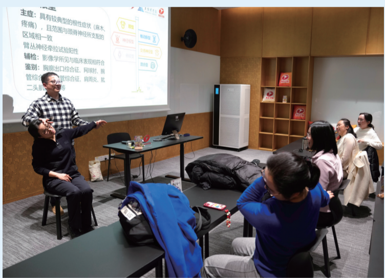
2025年3月20日晚,上海图书馆青年夜校的学员们在“中医科学调整办公室的职业病”课程。

应对有经验、政策有保障、制度有优势、市场有潜力、企业有活力、坚韧不拔的中国经济,必将在风雨后更加茁壮。