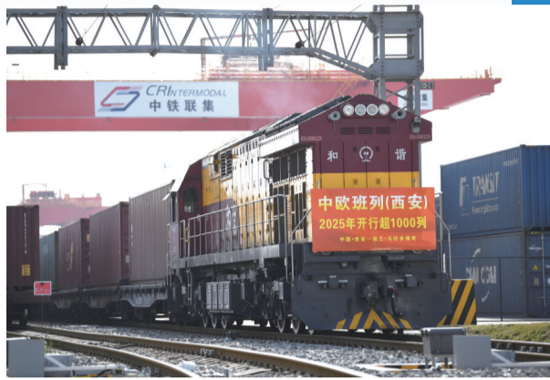
2025年3月21日,满载货物的X8489次中欧班列在西安国际港站准备发车。

“在充分肯定成绩的同时,我们也清醒地看到,当前外部环境更趋复杂严峻,全球贸易保护主义快速升温,世界经济秩序受到重创,国内结构转型任务仍然比较繁重。”盛来运说,持续推动经济回升向好,需要付出更加艰巨的努力。