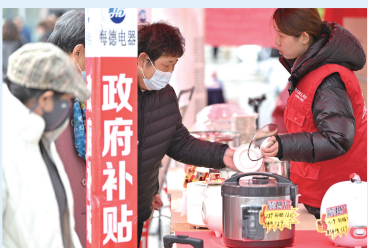
2025年3月28日,天津市北辰区举办消费品以旧换新惠民服务活动,居民在现场选购家电。