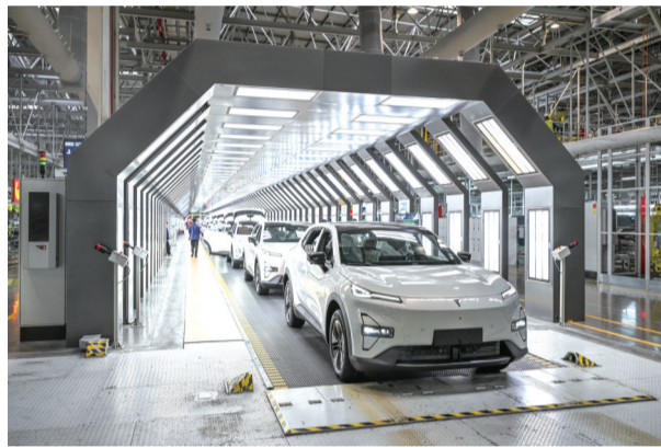
2025年1月9日在位于重庆市渝北区的长安汽车数智工厂总装车间拍摄的即将下线的新能源汽车。