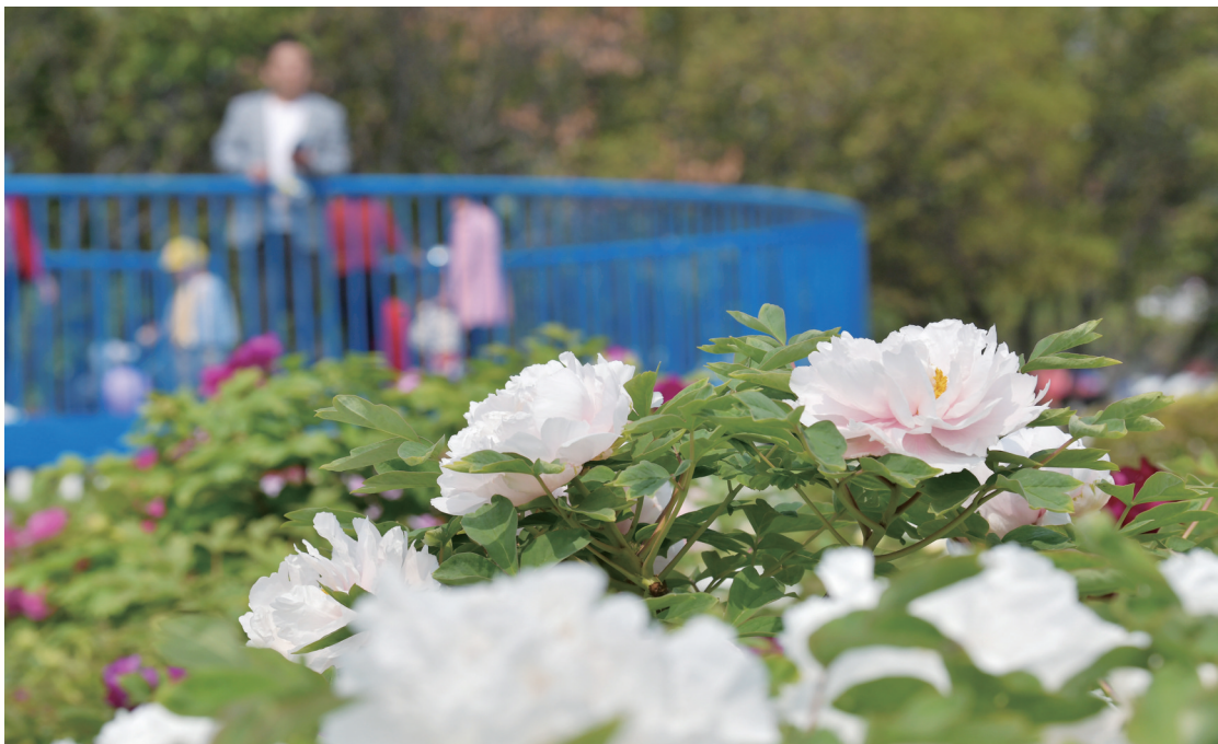
牡丹花开