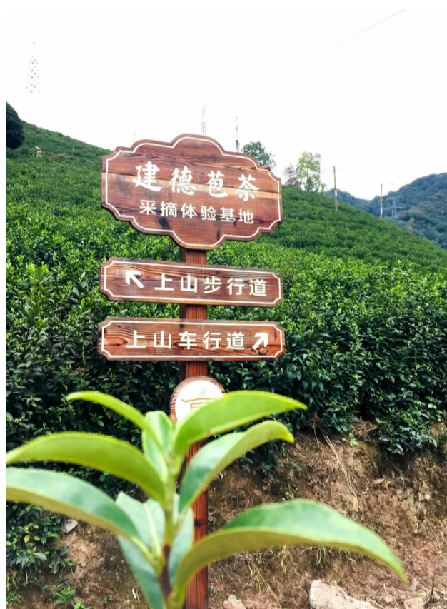
岭后社区大坪茶山