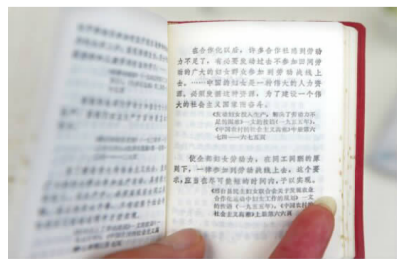
收录在《毛主席语录》第257页的按语