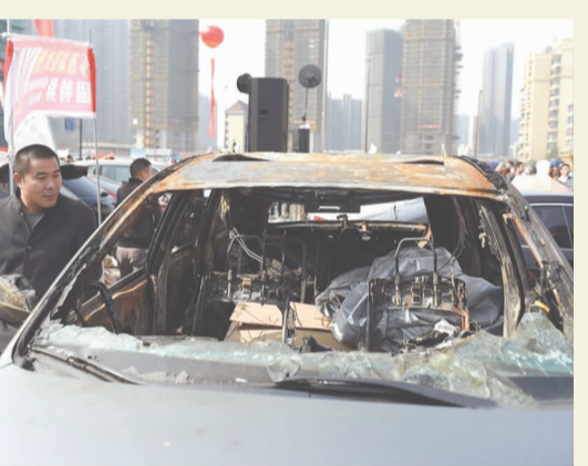
一名参观者在“问题车展”现场观看一辆发生过自燃的汽车。