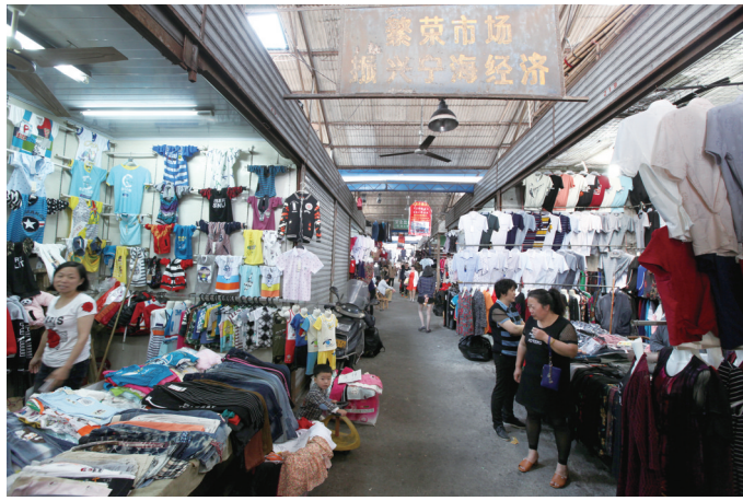
各类小商品琳琅满目