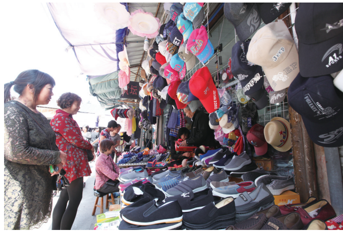
商品价格也比较亲民