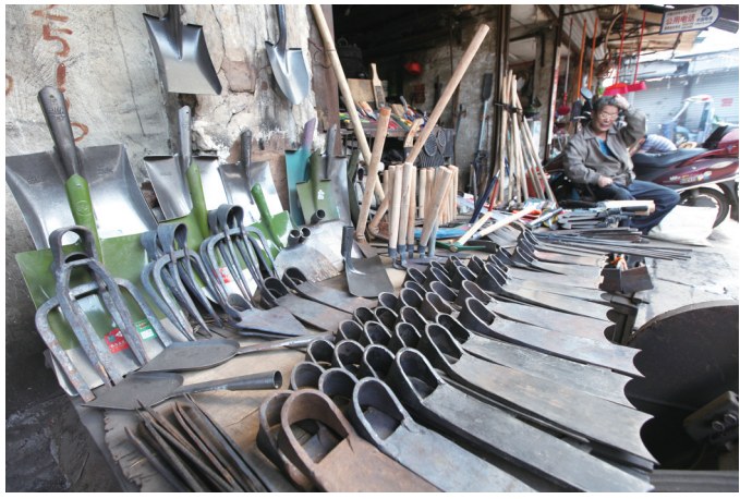
农具是小商品市场的特色