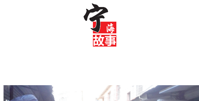
县领导考察小商品市场