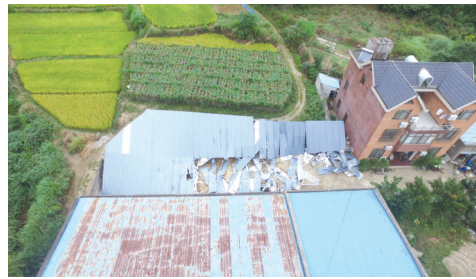
跃龙街道“智慧网格”利用无人机巡查违建