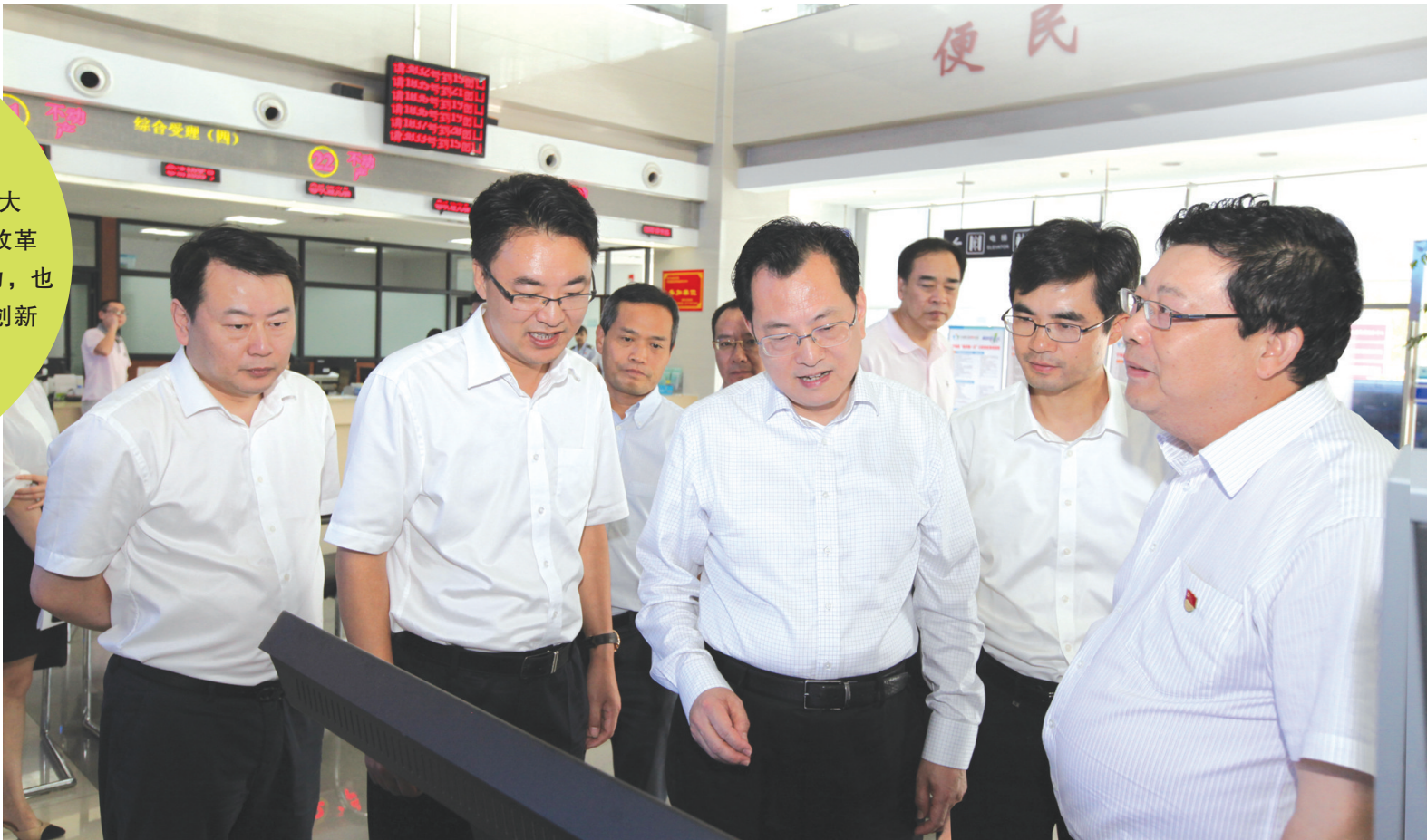
宁波市市长裘东耀(中)来宁海考察指导“最多跑一次”改革