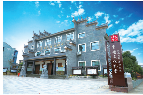
农村文化礼堂成为农村群众的精神家园