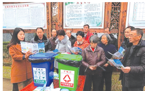
岔路镇下畈村工作人员指导村民垃圾分类