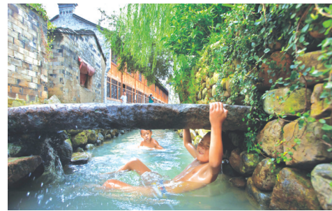
“五水共治”让“可游泳的河”不再难觅