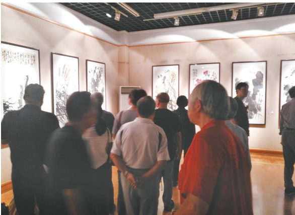
陈林干《水墨逍遥》中国画作品安徽展。