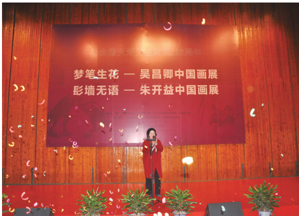
吴昌卿《梦笔生花》、朱开益《影墙无语》中国画展在宁波美术馆展出。