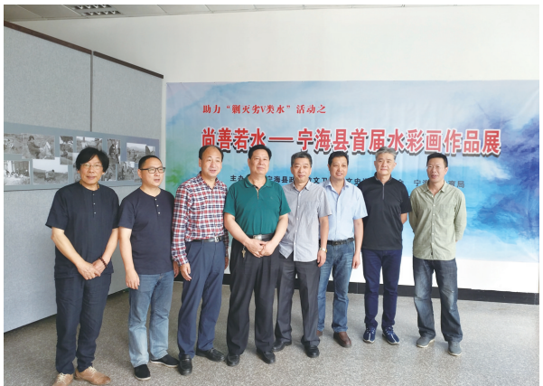
《尚善若水》宁海县首届水彩画作品展。