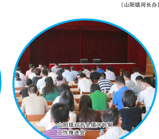
山阳镇召开全镇河长制工作推进会