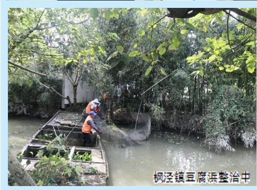
枫泾镇豆腐浜整治中

通过开展河道“三清”——清河岸、清河面、清障碍,确保“河面无漂浮物,河中无障碍物,河岸无垃圾物”,努力打造最美丽人居环境。枫泾镇将全力以赴推进消除黑臭和劣Ⅴ类水体工作,推动河长制落地生根,以更大决心、更硬措施打好碧水保卫战。