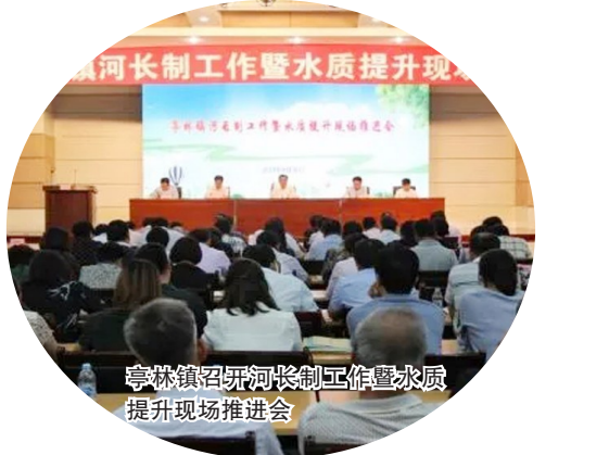
亭林镇召开河长制工作暨水质提升现场推进会

会前,镇一级河长、相关职能部门负责人、各村居书记及主任一行,前往程水港、亭东戚家浜及龙泉村后河进行河道巡查。 镇各级河长,相关职能部门负责人,各村河道巡查员共200余人参加会议。