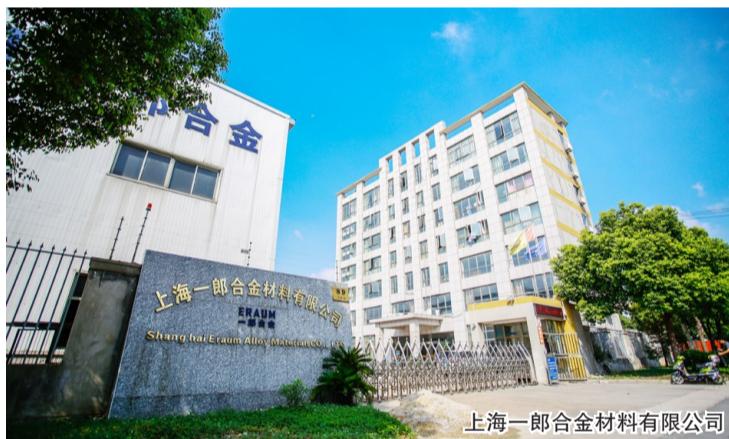
上海一郎合金材料有限公司

一郎合金看好合金材料属于朝阳产业的市场前景,计划扩建年产航空发动机高温合金新材料产品2000吨项目,3—5年内销售收入预测可以突破10亿元,税收预计达3000—6000万元。公司在提请政府相关部门审批项目时,相关部门按目录管理和正常流程,将其产品归入限制类“铸造”行业。这样,一郎合金项目审批遭遇困局:不能做!