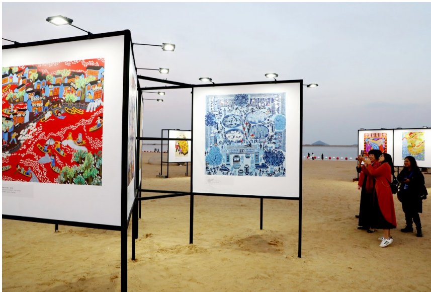
“追梦——中国农民画邀请展”在金山城市沙滩举行

此次中国农民画邀请展共收集到农民画作品945件，作品覆盖国内众多省市自治区，其中150幅作品入选参展。中国各地农民画乡人杰地灵，绘画风格百花齐放，展现出多元、充满活力的农民画文化。此次画展将以“画”为媒、以“画”会友，以“画”育人，实现区域间的文化资源共享，给观众带来不同的文化视听体验，享受别样的文化大餐，共建文化繁荣。据悉，该画展将持续至本月27日，有兴趣的市民可以前往观看。