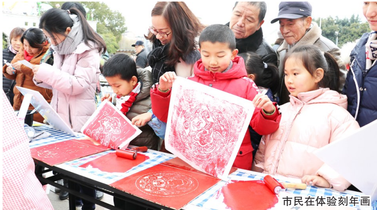
市民在体验刻年画

糍糕、糖画、吹糖人、八宝茶等充满传统年俗元素的摊位,吸引了不少市民驻足。迎春民俗文化集市在服务市民、推广传统手工艺的同时,也为市民们带来了多元民俗体验。现场,市民们三五成群捏着小老鼠面塑、木刻年画……饶有兴致地体验不同门类的非遗技艺、民间艺术,感受传统文化的魅力。欢乐、笑脸是现场市民的幸福标签,市民也在唐装全家福留影墙前留下新年