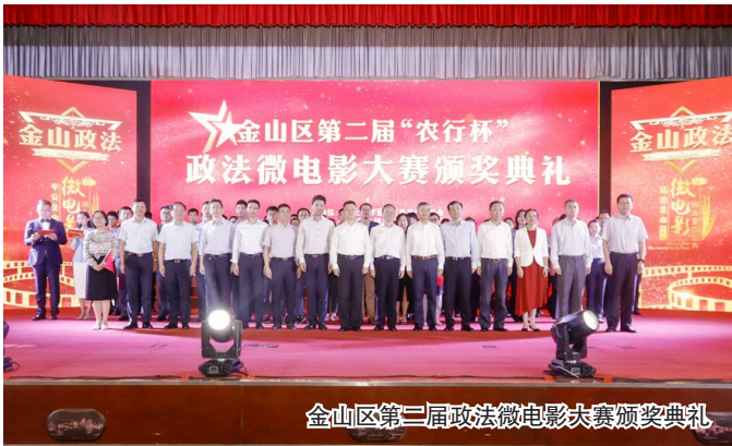
金山区第二届政法微电影大赛颁奖典礼