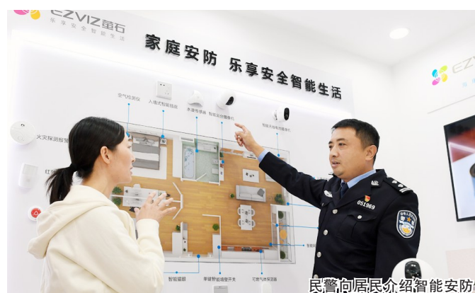
民警向居民介绍智能安防