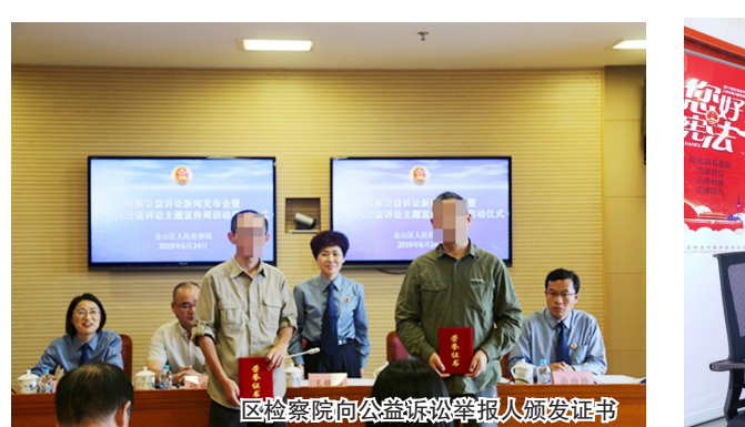
区检察院向公益訴訟举报人颁发证书