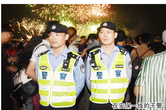
在安保一线的干警

组织推动纪律作风整顿。坚决压实责任,深化落实全面从严治党“四责协同”机制,充分运用好执纪监督“四种形态”,特别是第一种形态作用。重拳惩治腐败,对违纪违法案件特别是充当黑恶势力“保护伞”、办关系案人情案金钱案等执法司法腐败问题,坚决依法严厉查处。做实协管协查政法干部工作,探索完善政法委协管政法干部机制,健全派驻纪检监察机构与相关职能部门协同联动机制。