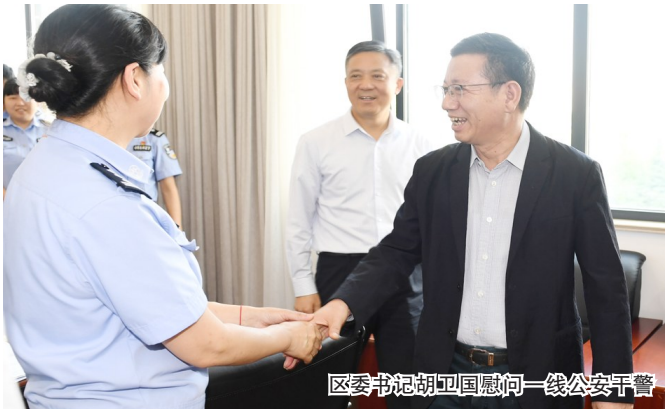
区委书记胡卫国慰问一线公安干警