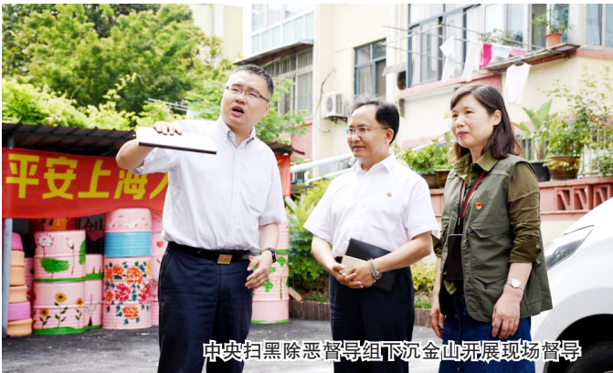
中央扫黑督导组下沉金山开展现场督导