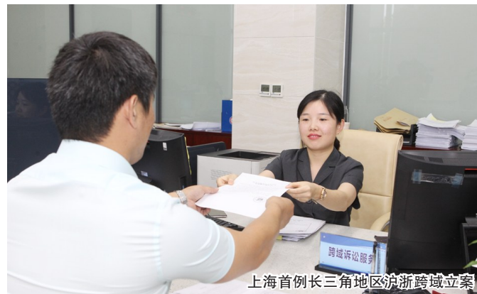
上海首例长三角地区沪浙跨区域立案

中央电视台、法制日报、解放日报等中央、市主流媒体报道金山政法工作460余篇次。在全市率先上线政法融媒体平台,金山区政法网宣铁军建设经验在全市大会上交流。平安金山新媒体账号多次冲入全国政法委影响力前20榜单。举办第二届金山政法微电影大赛,一等奖作品《猎豹》登上学习强国视听目录。区见义勇为教育基地升级为市见义勇为纪念广场,金山禁毒分馆全面改版投入使用,宣传辐射面进一步拓宽。