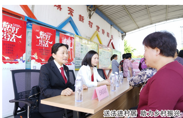
送法进村庄 助力乡村振兴