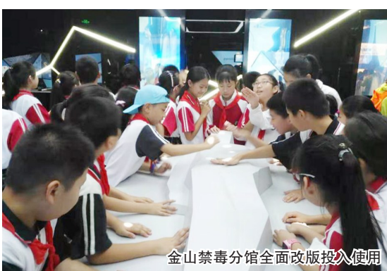
金山禁毒分馆全面改版投入使用