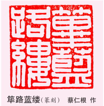
筇路蓝缕(篆刻) 蔡仁根 作

听完岳父讲的故事，我们都陷入了沉思之中，岳父接着说：“一只鸚鵡，都宁愿通过自己的劳动去寻找食物，而不愿吃身边现成的东西，这对我们人类是多么深刻的警示啊。”