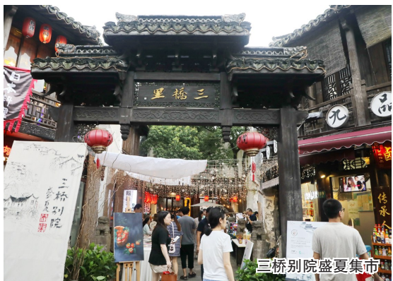
三桥别院盛夏集市