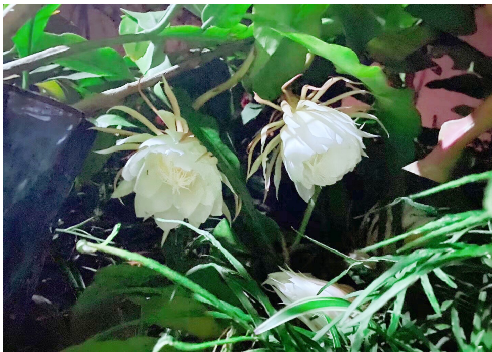
夜半昙花开 沈永良 摄

五千年的历史 让我们厚重 两百年的耻辱 让我们铭记 四十年的腾飞 让我们坚定 一百年的奋斗 让我们重新 实现“中国梦” 我爱这秋天里的 “中国红”