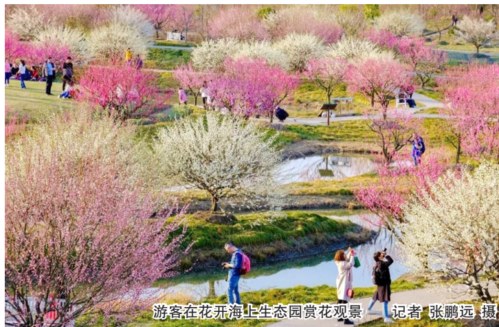
游客在花开海上生态园赏花观景

在住宿业方面,金山部分精品乡村民宿在春节前就出现了“一房难求”的局面,金山嘴渔村民宿入住率达到了83%。全区主要宾馆综合入住率达到七成,接近饱和状态。