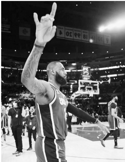
勒布朗·詹姆斯达到37000分后一脸平静。

在他达到37000分里程碑后，很多人打趣道：詹姆斯从不被认为是超级得分手，但如今在追逐贾巴尔总得分纪录的也只有他。 李永忠