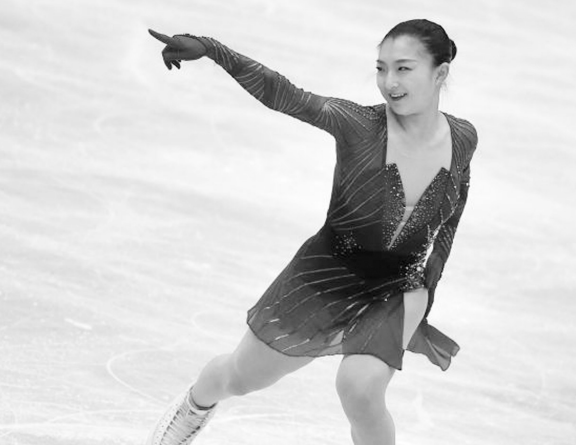
夺得蒙彼利埃世锦赛冠军的日本选手坂本花织在比赛中。

在男单比赛中，还有两位年轻选手的表现颇受关注——获得银牌的键山优真和美国新秀伊利亚·马里宁。不满19岁的键山优真正式升入成年组仅有两个赛季，但他的名下已有两枚世锦赛银牌与一枚奥运会银牌，并且他在参加的成年组国际赛事中从未跌出过前三名。作为一位跳跃质量、滑行技术与稳定性兼具的选手，键山优真在都灵周期的表现值得期待。虽然键山优真此次因自由滑表现不佳错失金牌，但所有人都确信他问鼎世