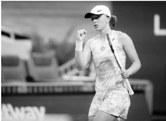
波兰美女斯瓦泰克能在WTA第一的位置上坐多久，是不少人关心的问题。

通过今年前三个月在硬地上的出色表现，斯瓦泰克已经彻底撕掉了“红土专家”的标签，而且她打逆风球的能力也得到了显著提升。