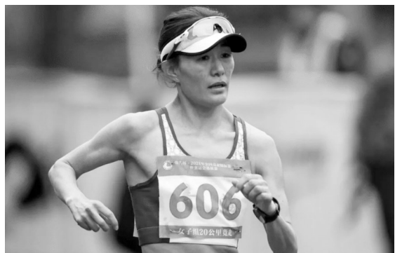
伦敦奥运会切阳什姐仅仅22岁，如今她已经32了。

还额外获得了3000元。这笔钱分量有多重？那一年国内的人均GDP是695元，许海峰的月工资是51.5元。