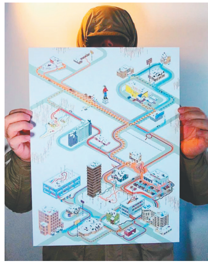
看了《冰血暴》的绘制图，观众可以对凶案发生的路径有了直观的感受。

要想把地图和电影两者完美结合在一起，需要倾注大量心血，要求绘制者有强大的信息提取、整合能力。为了捋顺