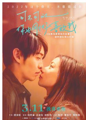
新近上映的《可不可以你也刚好喜欢我》，电影名达到了11个字。

电影以质取胜是必然，但好的片名也同样重要。片名就像是电影的门面，应该好听、好懂、好记，但又别太俗、太透。片名没有最好，只有更好。实在不行，也可以像当年的《中国合伙人》那样，借助观众的智慧来征名，还可以了解一下广大观众的意见。