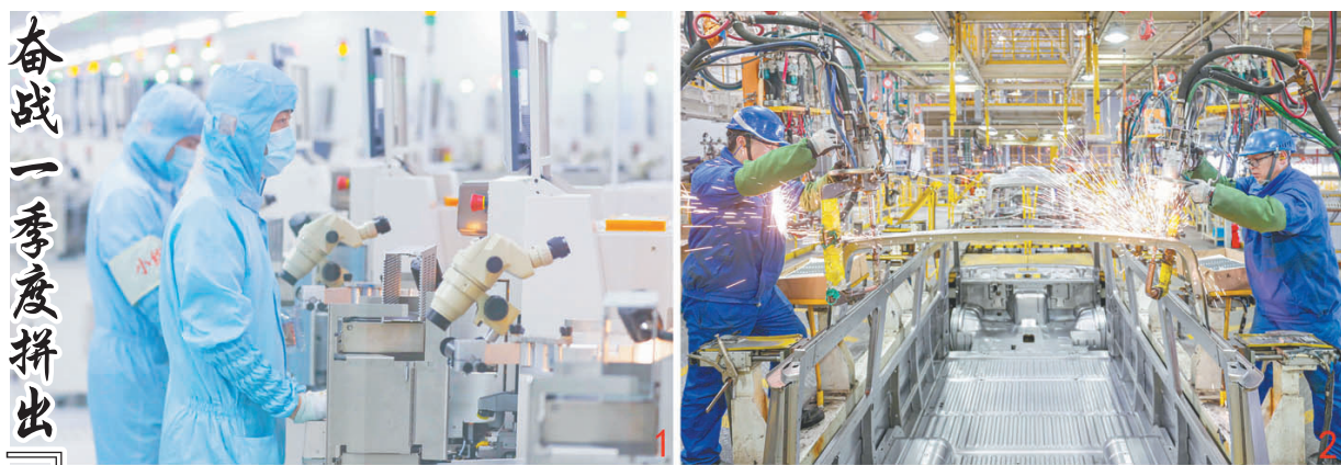
奋战一季度拼出『开门红』

以“绿”为本色的永钢集团,深入实践环保理念,打造一个天更蓝、水更清、环境更美好的美丽钢厂,开启高质量发展新征程。江飞/文