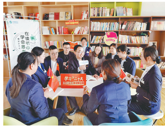
江苏移动“青年爱研习”宣讲“青骑兵团”向一线员工宣讲党的二十大精神。

江苏移动用心用情用力解决员工急难愁盼,努力把实事办到心坎上。面向基层员工建立薪酬“兜底”机制,面向特殊群体健全临退休关爱、住院慰问等保障制度;通过迁入新楼、院落出新等方式,持续改善基层生产条件;近五