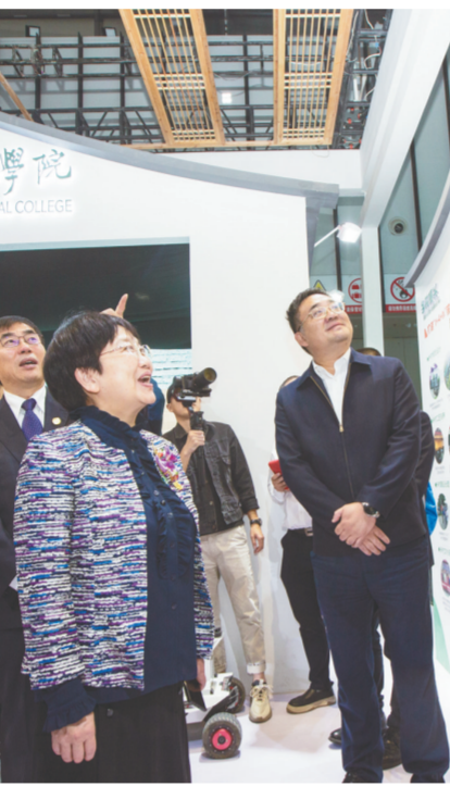
图说:“小小洗衣房”项目展示现场。