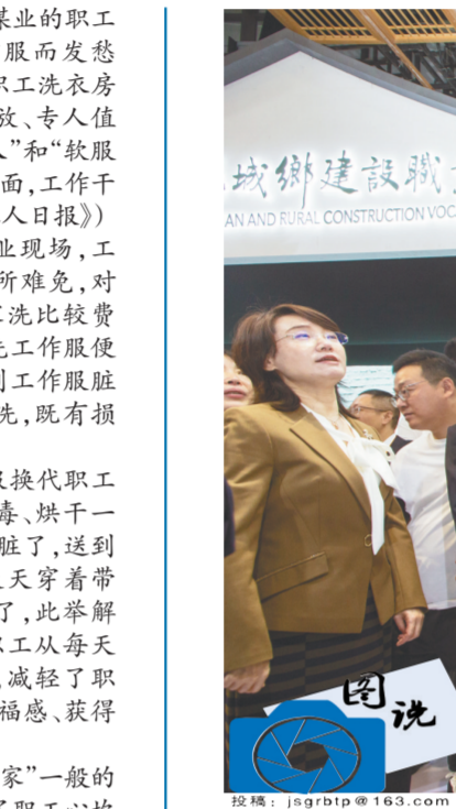
图说:“小小洗衣房”项目展示现场。

本报讯(记者王森)10月9日上午,江苏省高级人民法院召开新闻发布会,介绍全省贯彻实施人民陪审员法五周年工作情况,公布全省人民陪审员参审十大典型案例,备受社会关注的“哺乳期妈妈工伤”案入选。