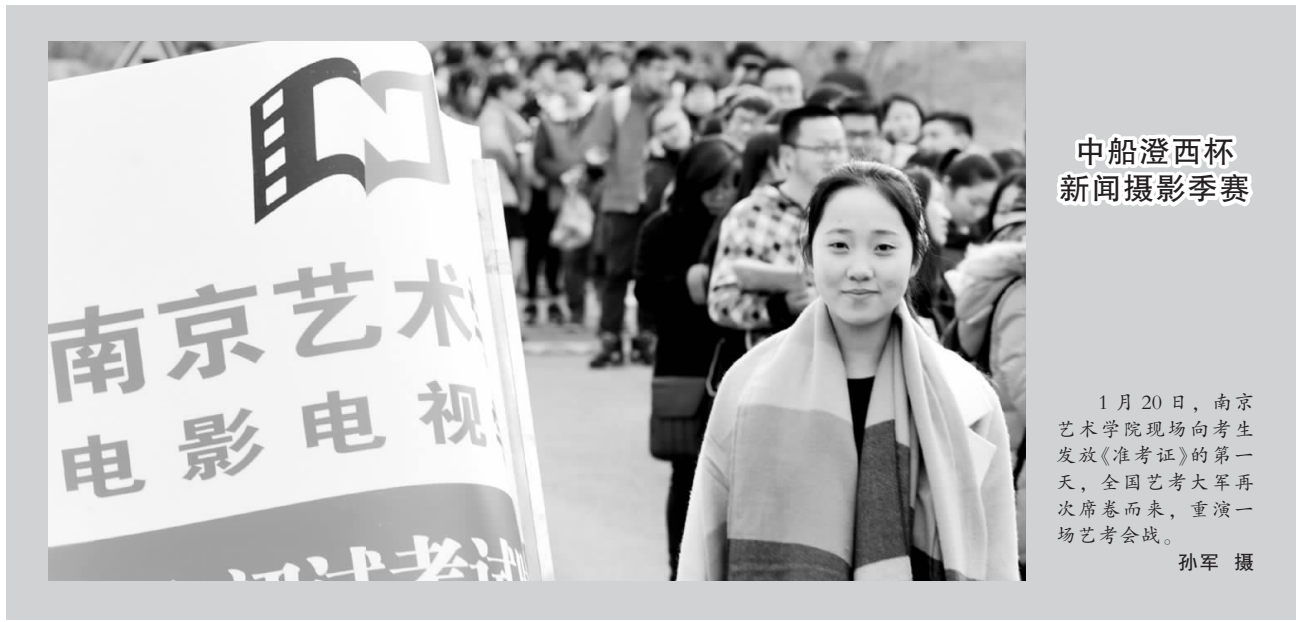
中船澄西杯 新闻摄影赛季赛

整为建筑安装工程费用和危化企业、高性能计算机信息系统以及易燃易爆场所的设备费用，降低幅度近50%，预计每年可减轻企业负担6000万元。