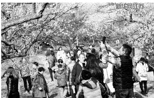
南京东郊梅花山梅花盛开，引来市民赏花游玩。