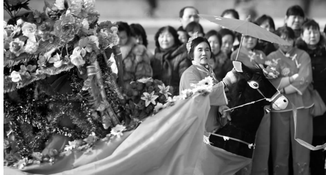
盱眙县民间艺人在进行民俗表演。