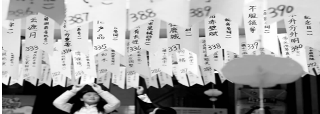
扬州少儿图书馆举办“新春灯谜会”。