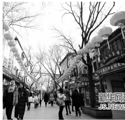
夫子庙街头大红灯笼高挂。