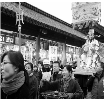
苏州观前街上“迎财神”。