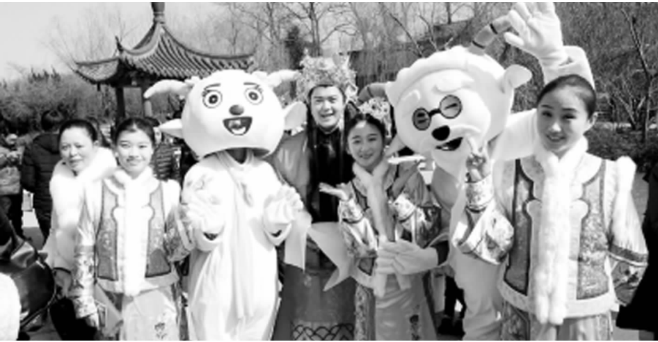
扬州景区内财神巡游送祝福。