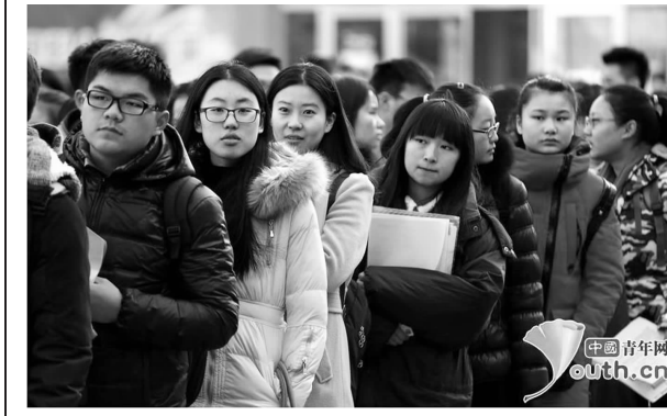
北京电影学院艺考大幕昨日拉开，全国各地万余名帅哥美女向着心中的梦想进行最后冲刺。