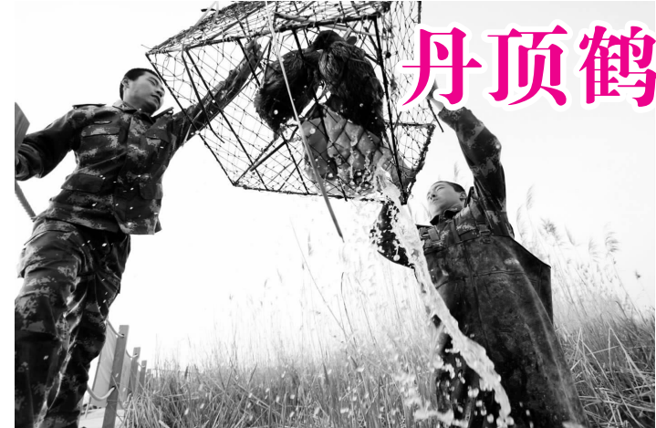
盐城边防官兵解救被困铁笼中的野生动物。

提起偷猎,很多人的第一反应可能就是可可西里、藏羚羊。可就在我省盐城,有一群人一直用自己的生命默默地面对着偷猎者的枪火,以及随时可能吞噬生命的沼泽地。他们就是江苏盐城边防支队的官兵。32年来,这群“与鹤共舞”的人,接替担当,成为了丹顶鹤保护区的平安“守望者”。