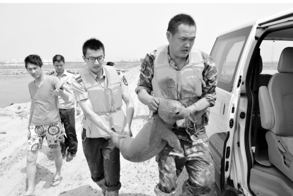
边防民警将小海豹救助上岸。

已几十年了,海豹在浅滩搁浅,这种稀奇事还是头一次。目前,这只长约1米左右,重约50公斤的小斑海豹,正在接受野生动物专家和医生的全力救治。