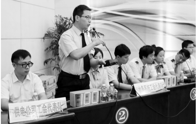
扬州市江都区总工会日前举办“中国梦·劳动美”职工学用法知识竞赛,推动了全区职工学用法的深入开展。