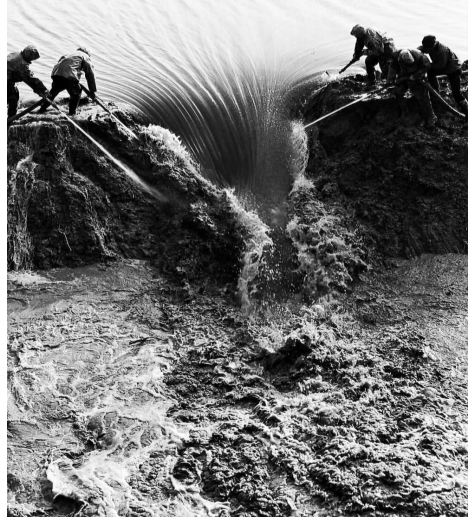
李建淮摄影作品《引来幸福水》