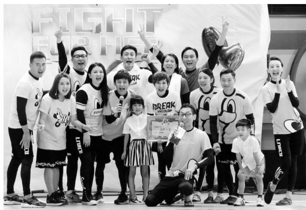
主持人与明星夫妻们喜贺《为她而战》第一季圆满收官。