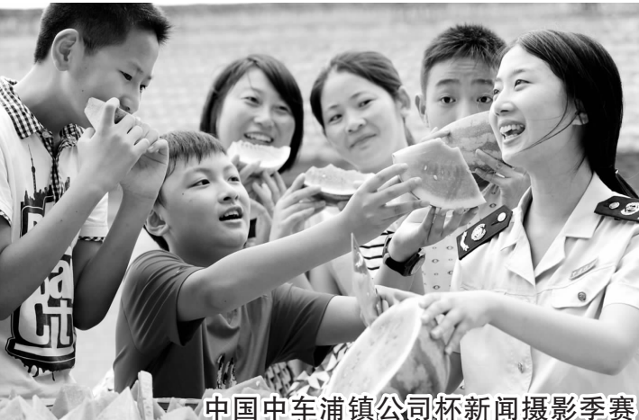
中国中车浦镇公司杯新闻摄影季赛留守儿童“啃秋”乐

上了公交车,张师傅就打开了总阀门。他告诉记者,为了防止电瓶漏电,夜里收车时,驾驶员们都会将总阀门关闭,确保第二天车辆能正常运行。说完,张师傅拿起一块