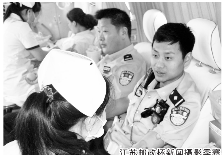
江苏邮政杯新闻摄影季赛

宿迁市公安局宿豫分局日前组织130名民警、辅警参加义务献血活动,以实际行动诠释了公安民警全心全意为人民服务的宗旨。