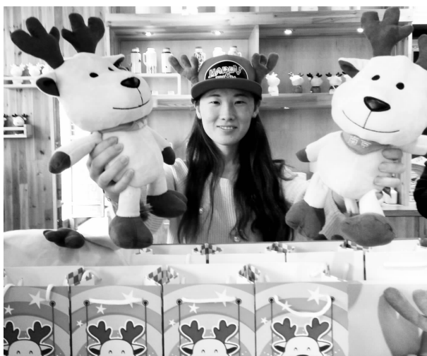
麋鹿形象的文创工艺品人见人爱。