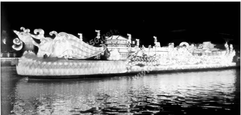
“泰州凤城河号”花船宛如运河上的金凤凰。