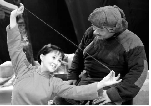
新版歌剧《白毛女》剧照