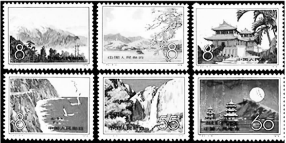
1979年中国邮政发行的《台湾风光》特种邮票