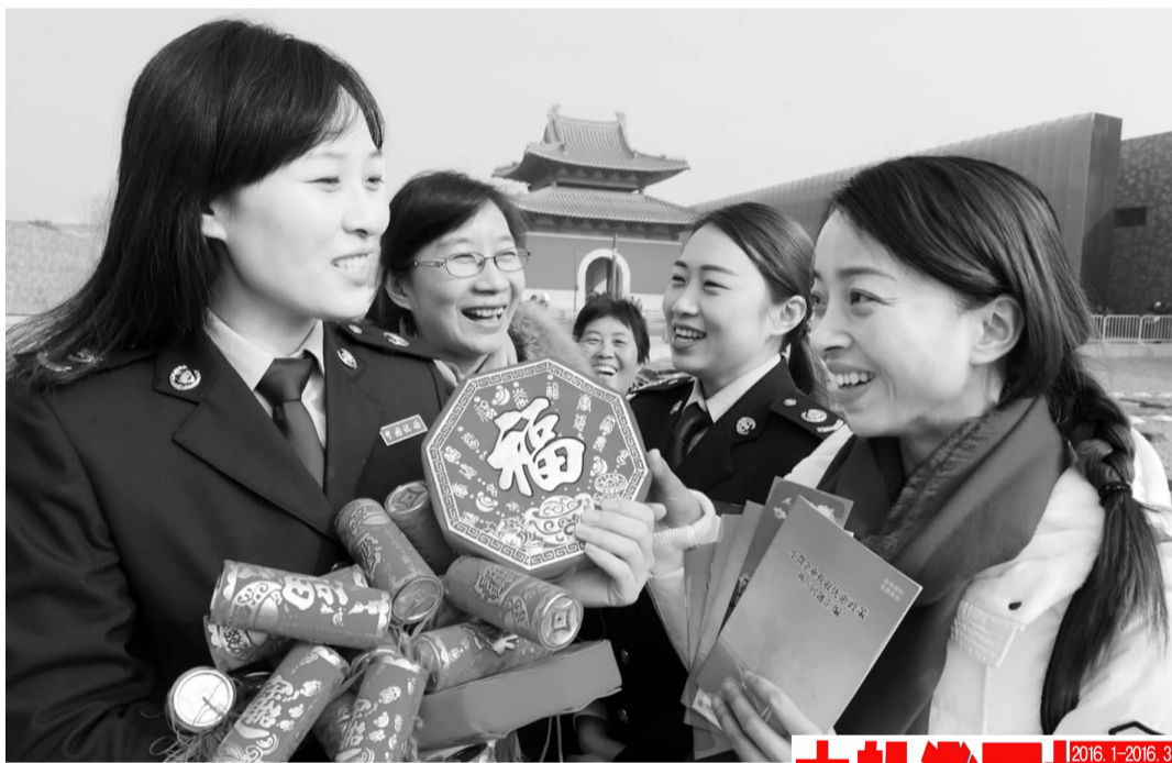
新年伊始,南京市“税收宣传志愿者”走进景区,热情地向游客赠送象征新年幸福的吉祥挂件和国家鼓励大众创业的税收读本,将志愿者们们的爱心传递到千家万户。