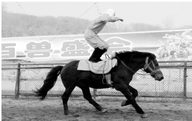
“猴哥”站立马背敢问路在何方