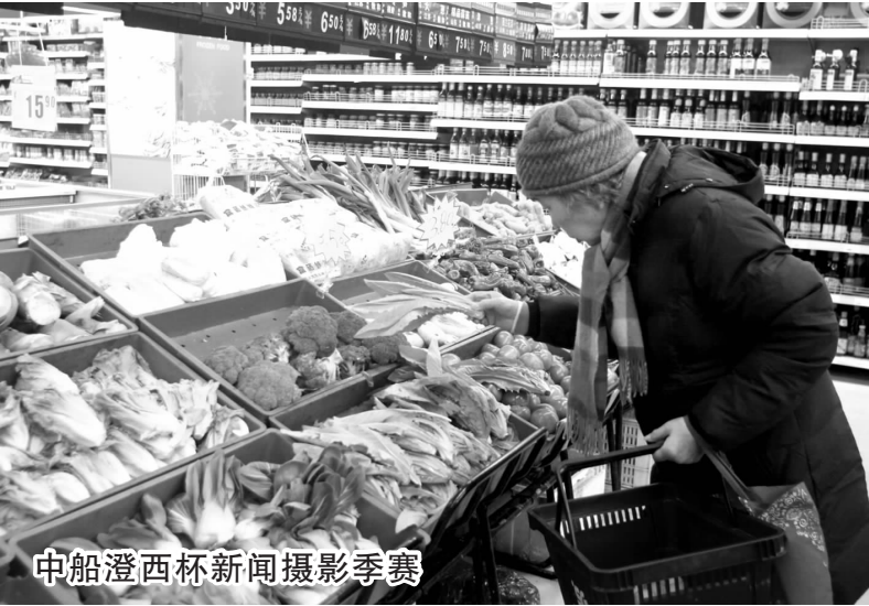
这几天南京的蔬菜售价特别是昨天有点贵，农贸市场和生鲜超市里的黄瓜都卖到了6.5元一斤、茄子5.98元一斤、青菜7元一斤、荷兰豆17.88元一斤，但众多市民为元宵节家人团聚，还是大包小包地往家拎。

明代著名中药学著作《滇南本草》中记载，苹果有“益胃，生津，除烦，醒酒”的功效。该院消化内科主任陈昱倩建议大家把苹果作为上班间隙的休闲水果。上班族多为脑力劳动者，很容易缺乏精力，苹果的天然香气，有助舒缓压力。而且苹果中含有矿物质钾，午后吃个苹果，可以使困倦的大脑快速恢复清醒状态。如果带苹果实在不方便，也可以买两瓶苹果醋放在办公室。