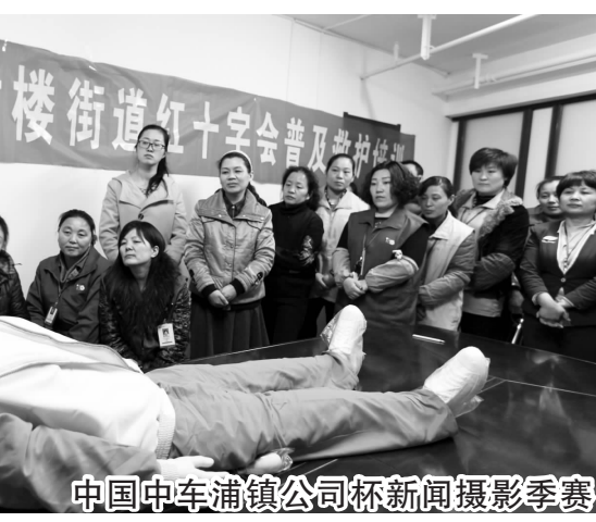
中国中车浦镇公司杯新闻摄影季赛

这五个区域“职工之家”服务平台,实行窗口受理、内部代办、窗口反馈的工作模式,由服务窗口受理接待,按接待内容由本级别或上级相关部门办理,处理结果一律由受理窗口反馈。五个服务平台都建在职工相对集中的区域,依托镇(区)便民服务中心,实行服务阵地共建共用,人员整合使用,网络互联互通,服务统筹开展。通过党工共建,群团联手,为群众提供“一站式、一条龙”服务,也让工会工作更接地气、更有人气。