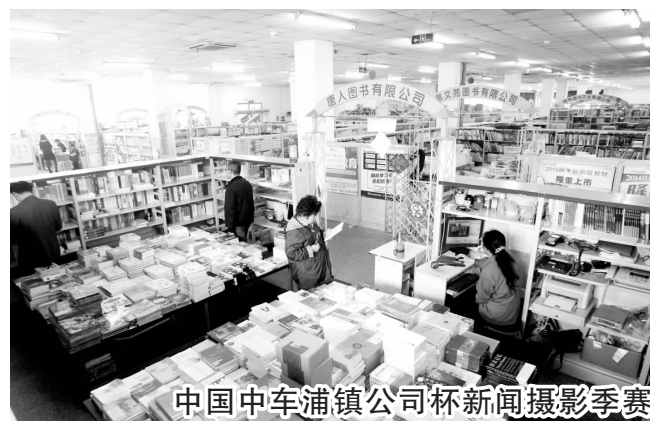
中国中车浦镇公司杯新闻摄影季赛

据介绍,詹天佑奖由中国土木工程学会和北京詹天佑土木工程科学技术发展基金会于1999年联合设立,奖项始终坚持“数量少、质量高、程序规范”的评选规则和“公开、公正、公平”的设奖原则,评选范围涵盖建筑、桥梁、铁路、公路、水利、住宅小区等土木工程建设项目,到目前为止,已有374个项目获奖。