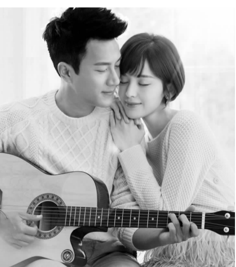
时尚爱情剧《柠檬初上》剧照