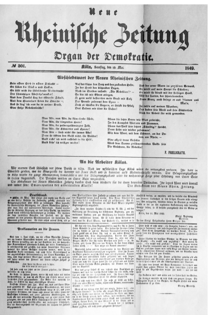
马志春珍藏的1849年5月19日《新莱茵报》停刊号

马志春珍藏的1849年5月19日《新莱茵报》停刊号也是对开2版,与创刊号色调所不同的是,停刊号全部用红色油墨印刷,头版头条刊登的是弗里格拉克特撰写的言语豪迈的告别辞。此外,在停刊号的头版还刊登了马克思和恩格斯撰写的社论《致科伦工人》,社论说:“《新莱茵报》的编辑们在向你们告别的时候,对你们给予他们的同情表示感谢。无论何时何地,他们的最后一句话始终将是:工人阶级的