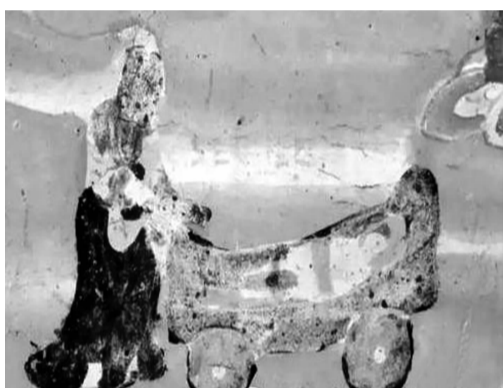
描绘母亲手推童车的莫高窟壁画

譬如,敦煌壁画中的《父母恩重经》细致描绘了孩子从出生到长大成人,父母养育他们的艰辛。而且,在莫高窟第156窟前室东壁门北壁画中,竟然还出现了看起来很现代化的婴儿车。在这幅奇特的壁画中,描绘着一位母亲手推四轮童车,婴儿安卧车中,有两条安全带护过车身,以防止婴儿不慎爬出车外。“栏车似母心,轳轳载儿行。石斑轮不转,千年更可亲。”一些被莫高窟壁画内容触动的网友以吟诗的形式表达心声与感恩。有不少网友被莫高窟壁画中呈现的古代人的孝道与母爱所感染,通过微博表示,“在现代生活中,母亲总是想尽力给我们最好的。从莫高窟壁画中,又看到了最具历史感的母爱故事。”冯志军