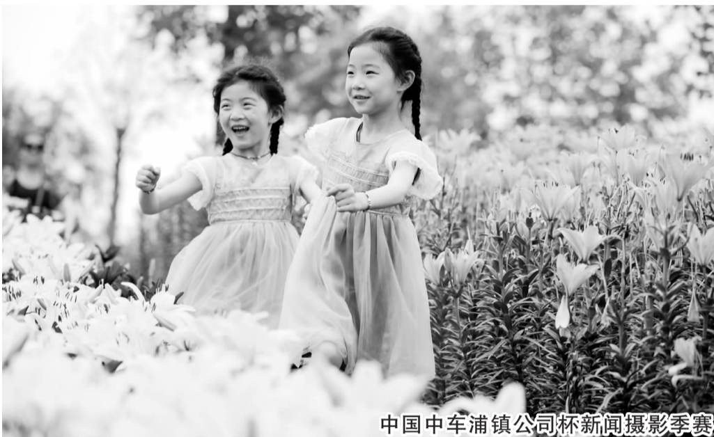
中国中车浦镇公司杯新闻摄影季赛

在采访中记者发现,每年的这个时候,应届毕业生的压力巨大,今年由于很多企业不景气,所以找到好工作更难。很多学生家庭条件一般,而物价今年又涨得比较厉害,为了应付这些开销,很多人在节俭之余,打临时工,靠父母支持,更有的摆起了地摊。