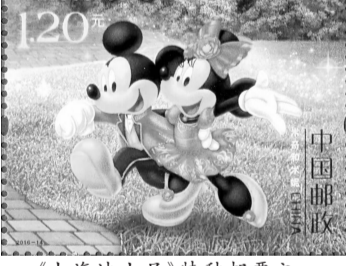
《上海迪士尼》特种邮票之一

《上海迪士尼》特种邮票一枚“米奇和米妮”邮票,将活泼可爱的“米老鼠”形象亮相于方寸之间,深受广大集邮迷的喜爱。邮票画面上的一对“米老鼠”情侣,一个身着中式立领装,一个身着牡丹花图案的上海迪士尼乐园主题服饰欢快地奔跑,显得喜气洋洋。