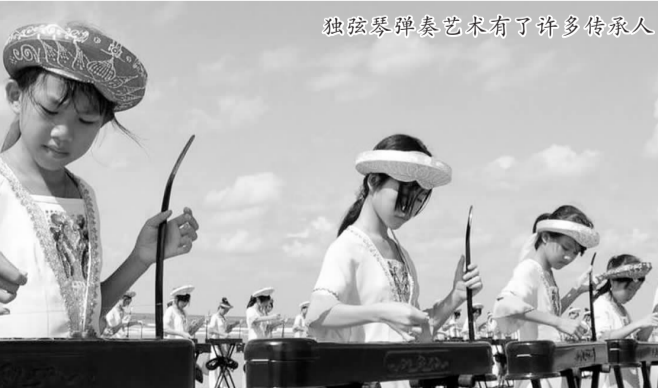
独弦琴弹奏艺术有了许多传承人

单乐器怎么能弹奏出美妙的声音呢?原来,其奥妙全在于一弦一杆。演奏者把独弦琴放在桌面上,坐着弹琴,用右手拿拨子触发琴弦各泛音点,手掌外侧轻触琴弦,发出泛音和基音的复合音。左手则通过推动摇杆,改变琴弦的张力,使之发出不同的元音来。独弦琴的弹奏方式复杂多变,有弹、挑、滚、推、拉、揉、撞、摇等多种手法,没有名师指导很难掌握到这么多的弹奏技巧。独弦琴作为泛音演奏乐器,具有柔和优美的音色,表现力极其丰富,非常适合于弹奏各种悠长抒情的旋律,其音调既能表现山川与大海的壮阔,又能抒发人们心中的欢乐。在京族人的生活中,独弦琴可供人们一人一琴,自娱自乐。在舞台上,独弦琴可以用于乐曲独奏,独弦琴弹奏的传