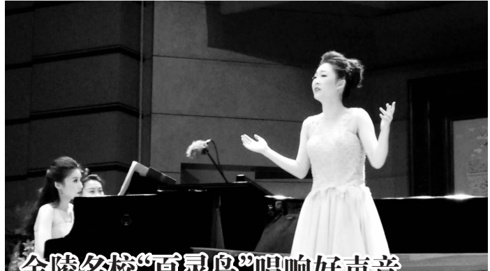
金陵名媛“百灵鸟”唱响好声音

《上海迪士尼》特种邮票小全张以上海迪士尼乐园奇幻童话城堡为中心,画面中展现了迪士尼经典的卡通形象,远处是隐约可见的上海地标性建筑,星空用多彩的礼花加以渲染,乐园里无处不在的新奇、刺激和冒险,仿佛都在等着人们去亲身感受。令人感到有趣的是,这套邮票的印制采用罕见的特效科技,让邮票上“米老鼠”的眼睛会闪烁发光。