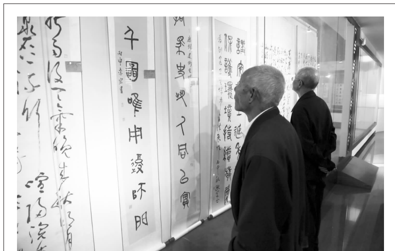
连云港市赣榆区人社局日前举办“共创卫生城市,共建美好家园”为主题的全区离退休人员书法展,此次展出的150余幅书法作品,均是由该区离退休人员精心创作,体现了老有所为、老有所学、昂扬向上的良好精神风貌。

发布的人力资源市场工资指导价和人工成本等综合信息,是对被调查企业部分工种、职位工资状况统计数据的真实反映,是供用人单位和劳动者参考的指导性信息,不是硬性规定的工资标准。因此,企业应综合考虑本单位的经济效益、人力资源市场供求状况以及今年工资增长等因素,合理确定本企业的工资水平及各类人员的工资关系。