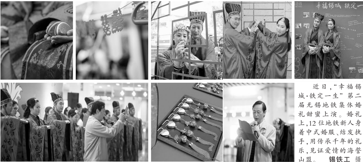
近日,“幸福锡城·铁定一生”第二届无锡地铁集体婚礼甜蜜上演。婚礼上,12 位地铁新人身着中式婚服、结发执手,用传承千年的礼乐,见证爱情的海誓山盟。