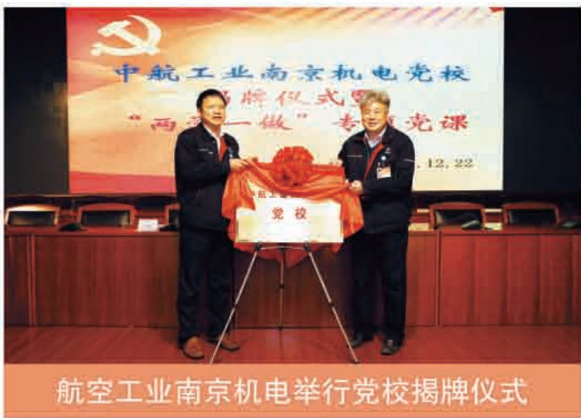
航空工业南京机电举行党校揭牌仪式