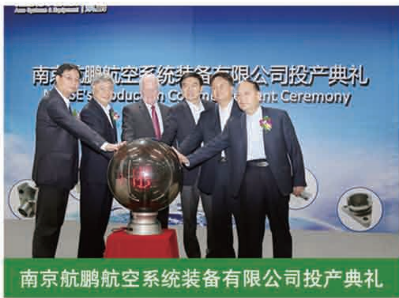
南京航鹏航空系统装备有限公司投产典礼