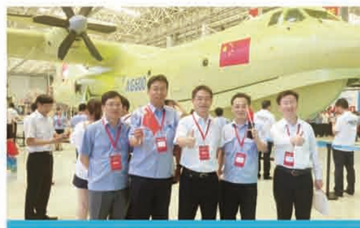
南京机电是AG600飞机最大的机载系统供应商

党的十八大以来,航空工业南京机电在贯彻实践“创新、协调、绿色、开放、共享”的发展理念上趟出了一条新路,着力提升企业发展品质、企业运行品质、技术发展品质和员工生活品质,以创新驱动带来产业的换代升级和效益的倍增,助推企业发展驶入了快车道。期间,南京机电圆满完成了五年“双倍增”的目标,不断增强员工的“获得感”,为“十三五”企业的跨越式发展奠定了良好的基础。