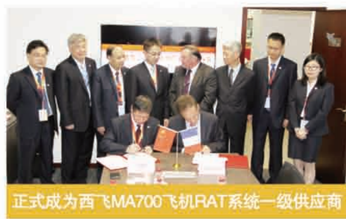
正式成为西飞MA700飞机RAT系统一级供应商