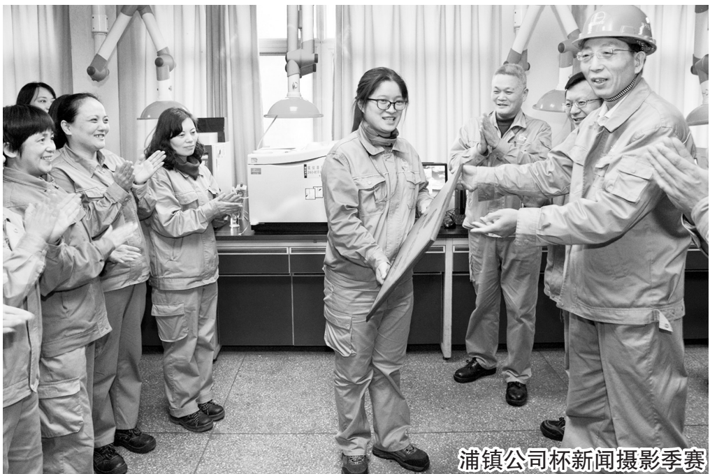
浦镇公司杯新闻摄影季赛

二是通过“微心愿”晾晒不满意。坚持会员评家制度,在公司设置“心愿墙”,积极向广大员工征集不满意,分别对工会组织的不满意、对工会主席的不满意