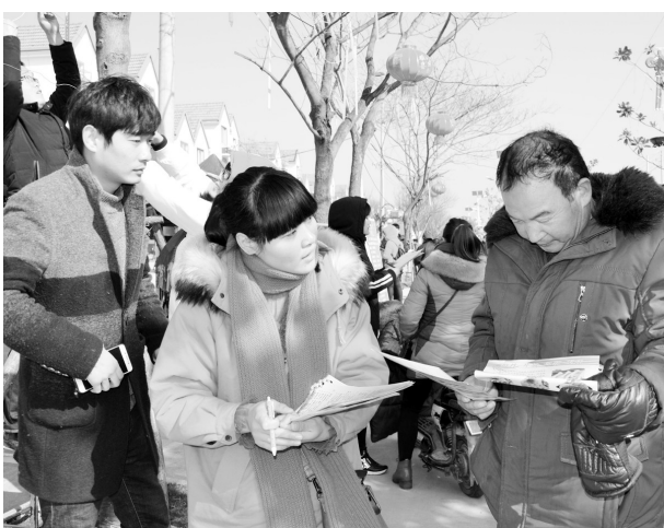
“春风行动”启动以来，宿迁市宿豫区人社局每天组织企业深入乡镇、街道，将就业岗位送到求职者的家门口。